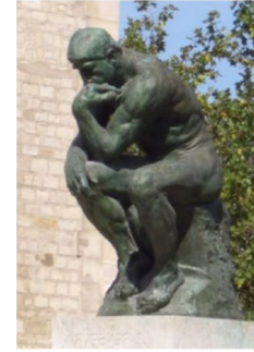
La pensée du jour