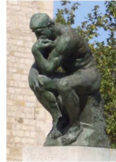
La pensée du jour

On commence à vieillir quand on finit d'apprendre. Proverbe japonais